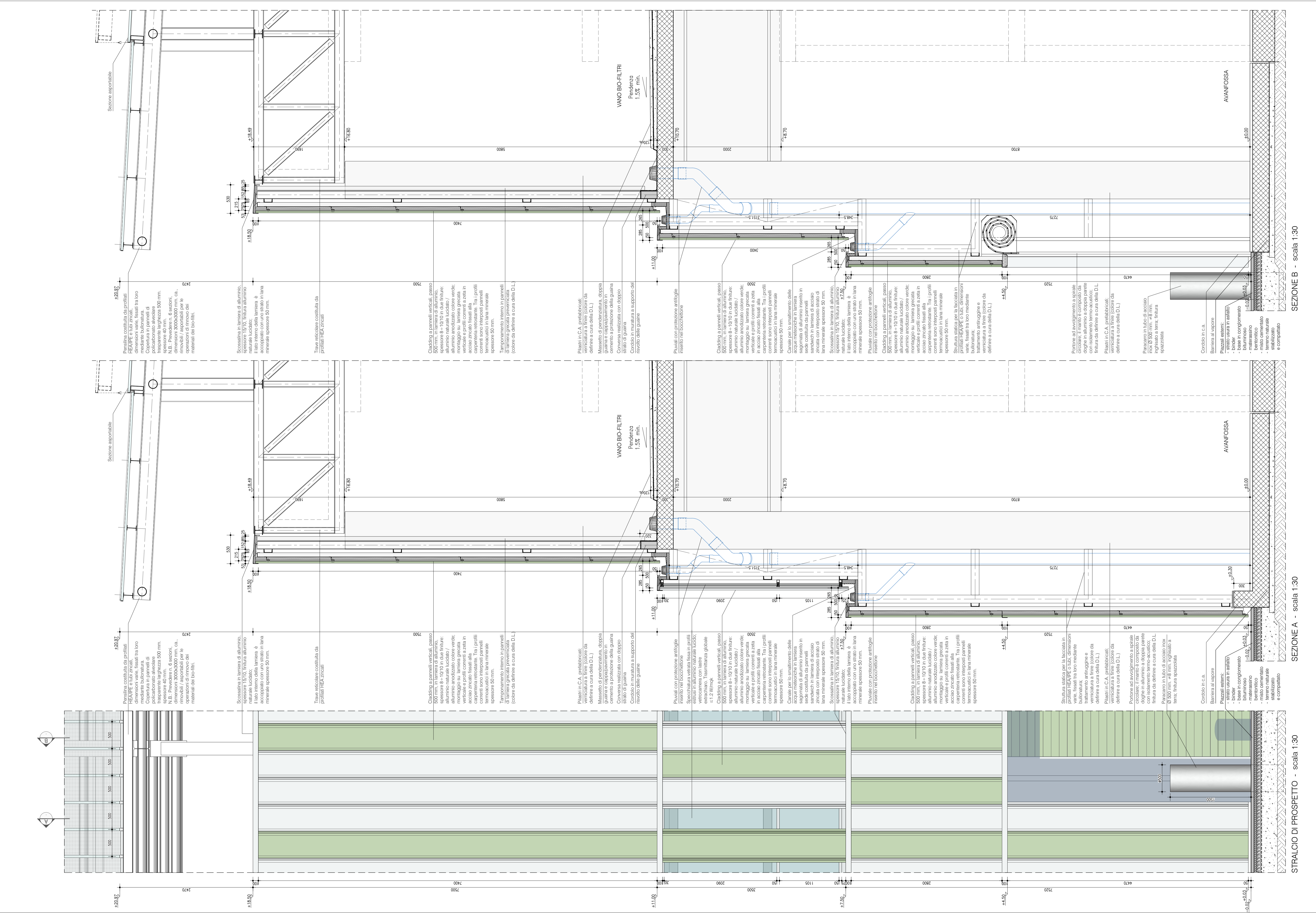
SEZIONE B - scala 1:30